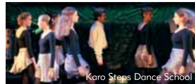
Karo Steps Dance School