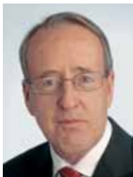
Liebe Freunde Irlands

Mit Freude darf ich Ihnen das Programm zu den St. Patrick's Day Feierlichkeiten ankündigen. Früher wie auch heute verbindet Irland und die Schweiz vieles. Es macht uns daher sehr glücklich, dass Irlands Nationalfeiertag St. Patrick's Day wie vielerorts auf der Welt nun bereits zum zweiten Mal auch in Zürich gefeiert wird.