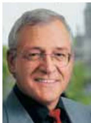
Wir leben Zürich

Liebe Freunde aus und von Irland. Wir freuen uns sehr, dass der irische Nationalfeiertag wiederum in Zürich gefeiert wird. Ich erinnere mich gerne an die Festfreude, welche die Irländerinnen und Irländer das letzte Jahr ausgestrahlt haben. Sie ist ein Zeichen, dass es Ihnen bei uns wohl ist.